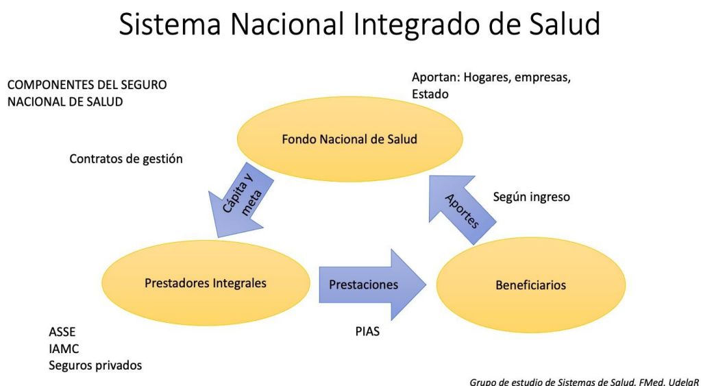
Figura 3. Componentes del Seguro Nacional de Salud.

En términos operativos, el SNS, es financiado por el FONASA. El BPS es la institución que recepciona los aportes al FONASA y efectiviza el pago de las cuotas salud a los prestadores integrales, de acuerdo a los órdenes de pago que emita la JUNASA, que es la responsable de administrar el SNS. (Ver JUNASA en Modelo de Gestión).