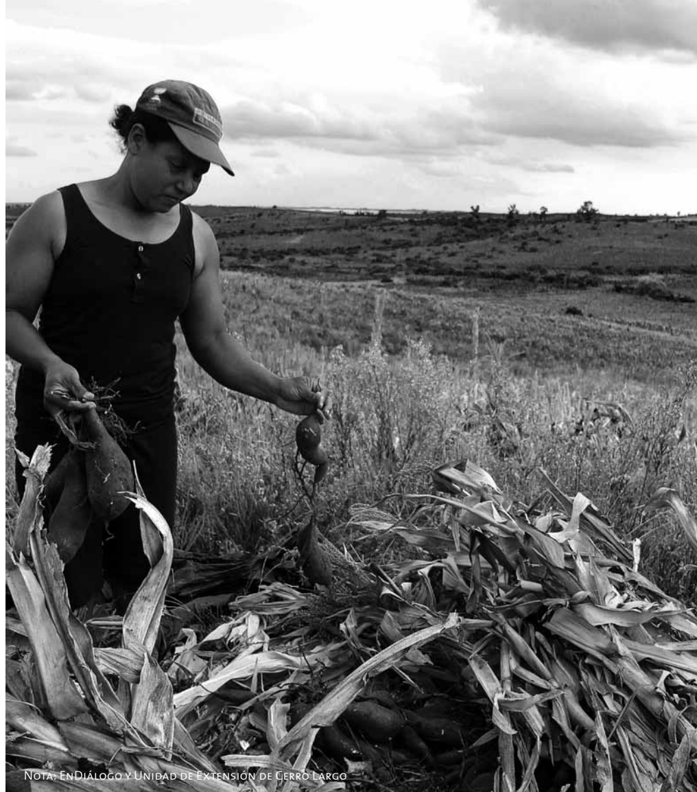
NOTA: ENDIÁLOGO Y UNIDAD DE EXTENSIÓN DE CERRO LARGO

“... el experimento no busca solamente soluciones productivas, sino antes que nada habilitar un espacio educativo.”